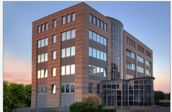
Abb.: Hauptsitz Serumwerk Bernburg AG in Bernburg

Die in Blending 8.1 abgebildeten Prozesse verwalten Chargen- sowie Seriennummern und bieten umfassende Möglichkeiten zur Produktions- und Supply-Chain-Planung. Eine lückenlose Chargenverfolgung ist jederzeit möglich. Seriennummern werden generiert und über TraceLink zum EU-Hub geladen, ebenfalls gescannt und kontrolliert. So ist die Serumwerk Bernburg AG in allen Bereichen optimal gerüstet und kann in eine effiziente Zukunft schauen.