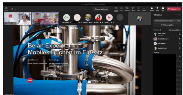
Abb.: Be-An-Expert Webinar vom 5. Mai 2022