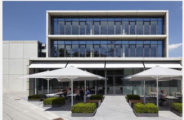
Abb.: Neubau am Hauptsitz Murtfeldt Kunststoffe GmbH & Co. KG in Dortmund