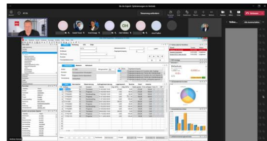
Abb.: Be-An-Expert vom 10. Mai 2022