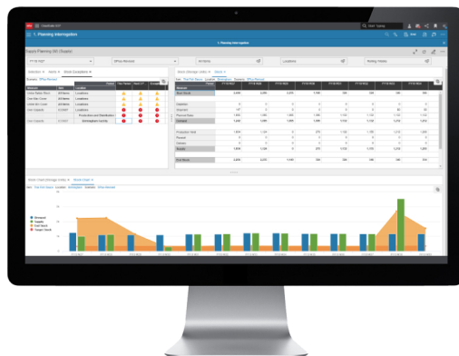
Szczegółowy przegląd stanu zapasów dla zakładu.